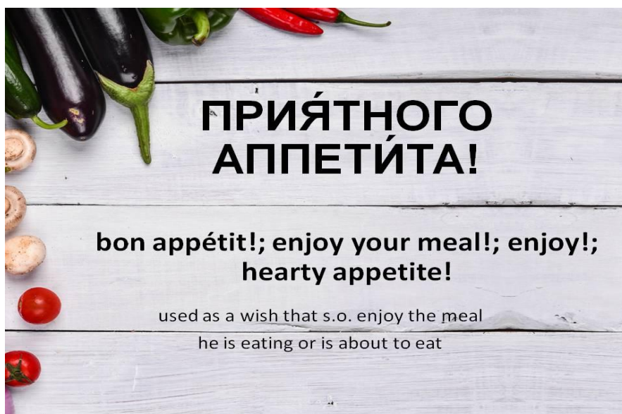
Рисунок 1 – Пример идиомы «Приятного аппетита» с переводом и комментариями

Ниже на рисунках 1, 2 и 3 приведены примеры разработок по изучению фразеологизмов русского языка. Данные материалы являются частью разработанного нами авторского дистанционного курса «Русский язык как иностранный», размещенного на образовательной платформе MOODLE УО «Полесский государственный университет».