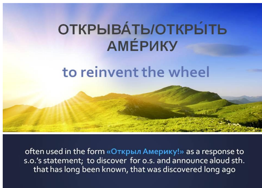
Рисунок 3 – Пример идиомы «Открыть Америку» с переводом и комментариями

В работе над разделом «Пословицы и идиомы» дистанционного курса «Русский язык как иностранный» нами были использованы материалы из «Русско-английского идиоматического словаря» под редакцией С. Любенски [12]. Вслед за автором мы сочли важным и необходимым давать не только перевод представленных в данном разделе идиом, но и дополнять его комментариями на языке-посреднике, которые помогут иностранным учащимся понять, где, когда и в какой ситуации целесообразно использовать данные идиоматические выражения.