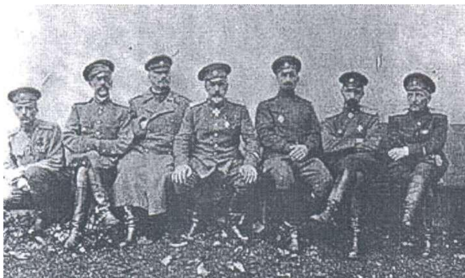
Генерал А.І. Дзянікін з камандуючымі арміяў Заходняга фронту. 1917 г