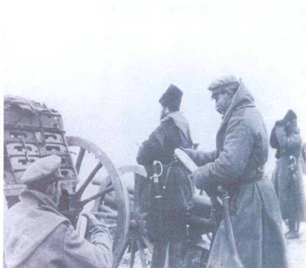
Расійскія артылерысты на пазіцыях. 1917 г.

Больш магутнай артылерыі, чым пад Крэва, расійская армія дагэтуль яшчэ не збірала. Такім чынам, лес гісторыі наканаваў аднаму з самых старажытных на беларускіх землях абарончых збудаванняў – Крэўскаму замку, вытрымаць самую буйную артылерыйскую атаку расійскіх войскаў за ўсю Першую сусветную вайну.