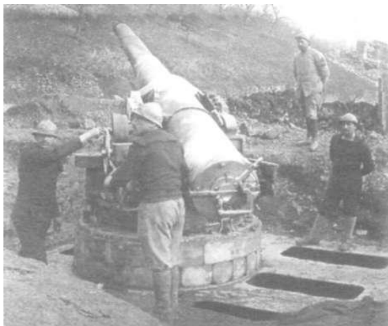
Такія гарматы дастаўляліся Антантай расійскай арміі ў 1916 – 1917 гг.

Меркавалася, што 10-я расійская армія пасля магутнага артабстрэлу варожых пазіцый здолее прарваць германскую лінію абароны ў раёне Крэва, авалодае населенымі пунктамі Сола, Жупраны, Граўжышкі і ў ходзе далейшага наступлення выйдзе на подступы да горада Вільня. Згодна з планам, пад Крэва была дастаўлена вялікая колькасць артылерыі. Па некаторых звестках, да месца прарыву было сцягнута 900 гармат самага рознага калібру. Гэтыя гарматы ў асноўным былі зроблены на заводах Англіі і ЗША, мелі дальнобойкасць звыш 20 кіламетраў і дастаўляліся на фронт разам з боепрыпасамі з розных расійскіх портаў.