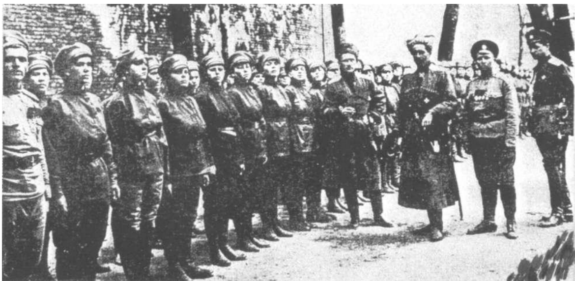
Агляд жаночага батальёна. Другая злева М. Бачкарова

Улічваючы вышэй адзначаныя абставіны, з мэтай падняцця маральнага баявога духу салдат, Часовым ўрадам у Петраградзе была створана «Першая жаночая ваенная каманда смерці», так званы «жаночы батальён смерці» пад камандаваннем Марыі Бачкаравай. З 2–х тысяч добраахвотніц былі адсеяны «ненадзейныя» і тыя, хто не вытрымаў суровых умоў салдацкага жыцця. У выніку ў батальёне засталася крыху болей двухсот найлепш падрыхтаваных да ваеннай справы жанчын. Менавіта пад Крэва, дзе распачалася падрыхтоўка сур'ёзнай наступальнай аперацыі, і быў накіраваны гэты жаночы батальён.