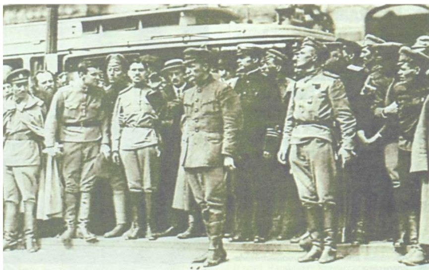
А.Ф. Керанскі праводзіць агляд войск на фронце

У выніку, камандуючы 10–й арміяй, якая павінна была вырашыць лес усёй аперацыі, быў папярэджаны, што ён у хуткім часе будзе зняты са сваёй пасады. Бясспрэчна, што, знаходзячыся ў такой сітуацыі, М.М. Кісялеўскі не мог узяць на сябе паўнаўладдзя кіраўніцтва ўсім ходам аперацыі. І ўсё ж расійскае камандаванне Заходняга фронту на чале з вядомым генералам А.І.Дзянікіным, які асабіста ажыццяўляў каардынацыю і ў сувязі з дадзеным інцыдэнтам больш звычайнага ўмешваўся ў ход аперацыі, ускладвала на пасляховае яе правядзенне вялікія спадзяванні.