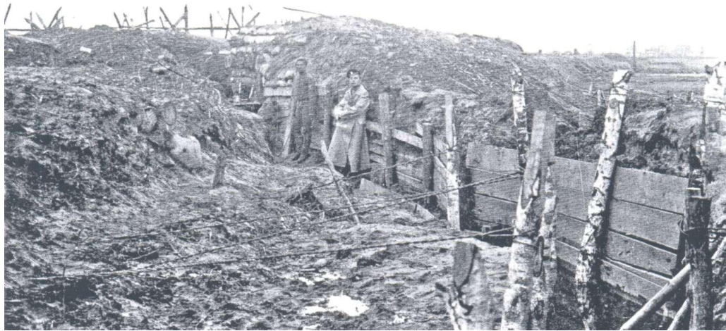
Расійскія акопы на перадавой у раене лініі Крэва–Смаргонь. 1917 г.

Улічваючы вышэй адзначаныя абставіны, з мэтай падняцця маральнага баявога духу салдат, Часовым ўрадам у Петраградзе была створана «Першая жаночая ваенная каманда смерці», так званы «жаночы батальён смерці» пад камандаваннем Марыі Бачкаравай. З 2–х тысяч добраахвотніц былі адсеяны «ненадзейныя» і тыя, хто не вытрымаў суровых умоў салдацкага жыцця. У выніку ў батальёне засталася крыху болей двухсот найлепш падрыхтаваных да ваеннай справы жанчын. Менавіта пад Крэва, дзе распачалася падрыхтоўка сур'ёзнай наступальнай аперацыі, і быў накіраваны гэты жаночы батальён.