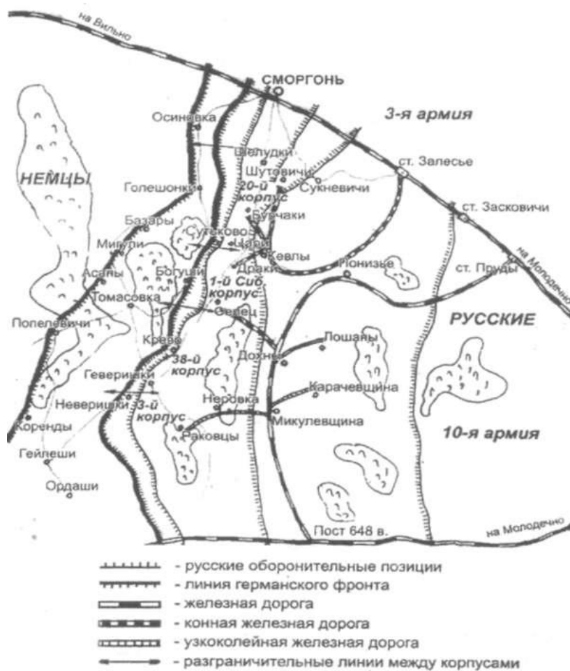
Схема наступальных дзеянняў 10-й арміі Заходняга фронту падчас ліпеньскай аперацыі 1917 г.

Менавіта гэтае наступленне стала жахлівым баявым хрышчэннем для байцоў «жаночага батальёна смерці». Батальён займаў пазіцыю паміж Крэвам і Наваспаскам і ўваходзіў у склад 1-га Сібірскага корпуса 10-й арміі, якім камандаваў генерал-лейтэнант Я.А. Іскрыцкі [1, с. 829].