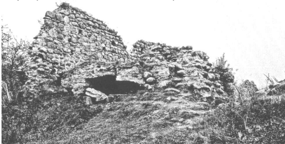
Замаскіраваны нямецкі дот у башні Крэўскага замку

замка і бліжайшых да яго іншых пабудовах. Фактычна, усе каменныя пабудовы ў мястэчку Крэва, былі прыведзены ў абарончы стан і значна павялічвалі абароназдольнасць нямецкіх пазіцый.