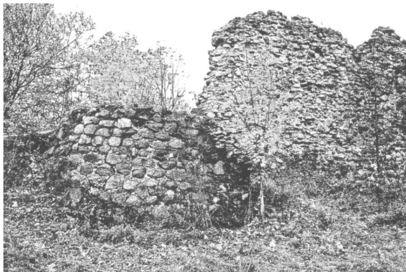
Бункер, збудаваны немцамі ў Крэўскім замку

Меліся надзейна збудаваныя бетонныя бліндажы, у якіх тапіліся грубкі і было электрычнае асвятленне, акрамя таго, электрычны ток быў падведзены да некалькіх радоў загародаў з калючага дроту. Электрастанцыя знаходзілася ў глыбока забетаніраваным бункеры, непадалеку ад вёскі Войневічы. Усе драўляныя пабудовы, што знаходзіліся побач з лініяй фронту, былі разабраныя для будаўніцтва самага рознага кшталту ўмацаванняў. Каб любым коштам утрымаць свае пазіцыі, немцы нават правялі з Гудагая да Крэва вузкакалейку, па якой на перадавую дастаўлялі харчаванне і боепрыпасы.