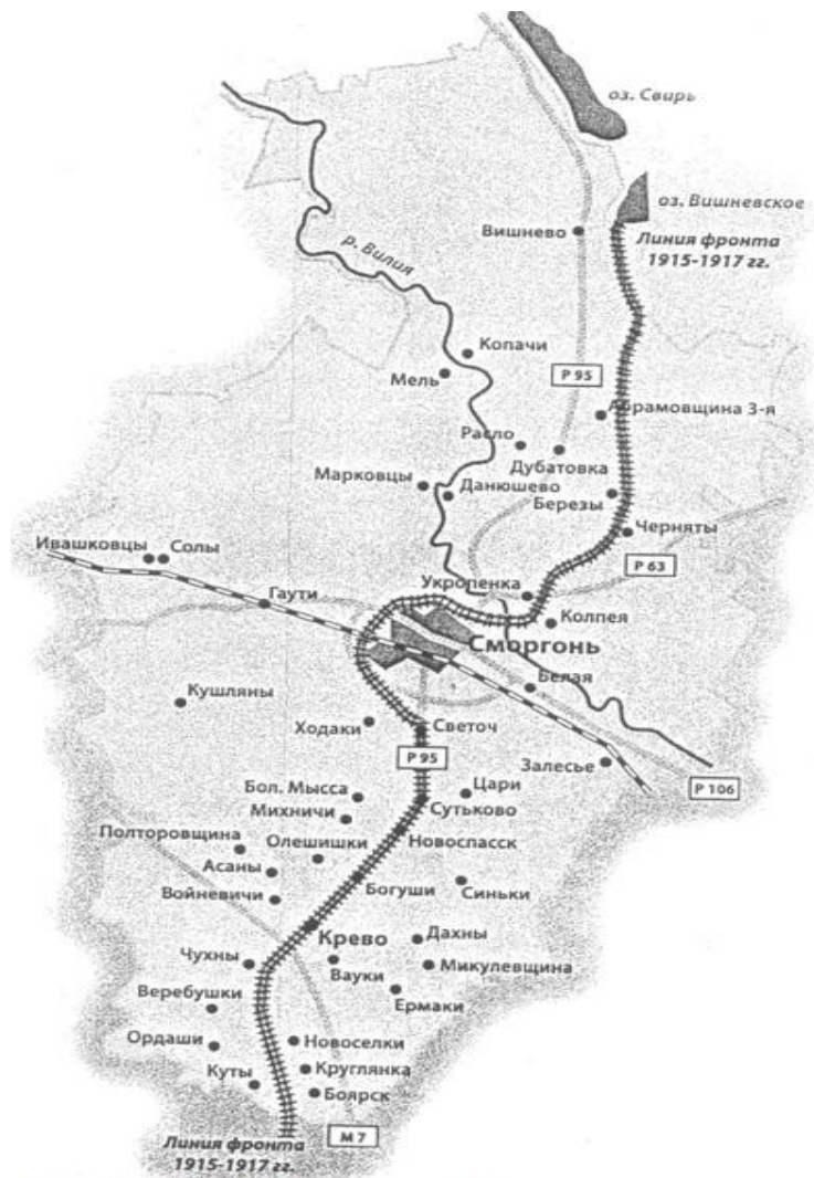
Лінія фронта на пачатку аперацыі

Уводзіны. Першая сусветная вайна была часам грандыезных перамен як у гісторыі ўсяго чалавецтва, так і ў беларусаў. У жніўне 1915 года на беларускіх землях распачаліся ваенныя дзеянні паміж расійскімі і германскімі войскамі. Нягледзячы на тое, што Свянцянскі прарыв, здзейснены кайзераўскімі войскамі, часткова быў ліквідаваны, усе ж значная частка заходніх беларускіх земляў аказалася пад германскай акупацыяй. Менавіта яшчэ тады, падчас завяршаючай стадыі самага буйнага прарыву Першай сусветнай вайны, у эпіцэнтры бязлітасных, упартых баёў апынуліся прыфрантавыя беларускія мястэчкі Крэва і Смаргонь. Пасля Палескай аперацыі ў кастрычніку 1915 года фронт стабілізаваўся на мяжы Дзвінск – Паставы – Смаргонь – Крэва – Баранавічы – Пінск. У выніку, больш чым два з паловай гады на дадзенай мяжы мела месца пазіцыйная вайна, у час якой акрамя Нарачанскай і Баранавіцкай аперацый на беларускіх землях была праведзена яшчэ і Крэўская ваенная аперацыя, якую з 6 па 9 (19–22) ліпеня 1917 года ажыццявіла 10-я расійская армія пад камандаваннем генерал-лейтэнанта М.М. Кісялеўскага і начальніка штаба генерал-маера А.Ф. Дабрышына [1, с.794].