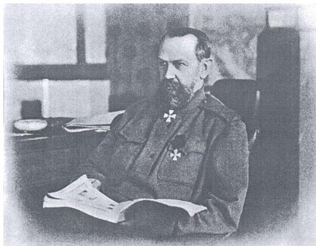
Генерал А.Е. Эвэрт

Такім чынам, прадоўжыць наступальную аперацыю, пачаваю генералам Брусілавым на Валыні, павінна была на беларускіх землях 4-ая армія пад камандаваннем генерала А.Ф. Рагозы, якая ўваходзіла ў склад Заходняга фронту пад камандаваннем генерала А.Е.Эверта. Прарыв абароны праціўніка на 8-кіламетровым участку фальварак Драбышы–Завоссе (цяпер Баранавіцкі раён) ускладаўся на найбольш вопытныя і ўкамплектаваныя 9-ы і 35-ы вайсковыя карпусы. Іх падтрымлівалі: на 2,5 кіламетровым участку ад Драбышоў – 25-ы корпус, за 10 км на поўдзень ад галоўнай атакі – дывізія Грэнадзёрскага корпуса і за 20 км – 2 дывізіі 10-га корпуса і Польшкая брыгада.