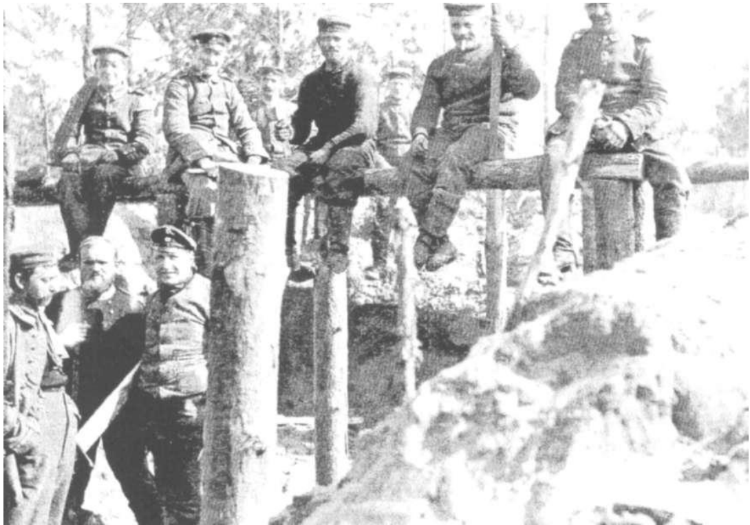
Нямецкія салдаты ўмацоўваюць абарончую лінію. 1916 г.

У той жа час начальнікам штаба расійскага галоўнакамандавання М.В.Аляксеевым і галоўнакамандуючым Заходнім фронтам А.Е.Эвертам прымаліся ўсе неабходныя меры, якія на іх думку маглі паспрыяць дысцыпліне сярод салдат і абмежаваць доступ інфармацыі аб дэталях новага наступлення для праціўніка. Так падчас аперацыі выдаецца загад Эверта «Па барацьбе з п'янствам», дзе забараняецца ўсялякі продаж, набыццё і распіццё спіртных напіткаў [4]. А затым на падставе «Правіл аб мясцовасцях, аб'яўленых на ваенным становішчы» былі праведзены во-быскі сярод прыфрантавога насельніцтва, а таксама арганізаваны прагляд пісьмаў, запісаў салдат і г.д. [5].