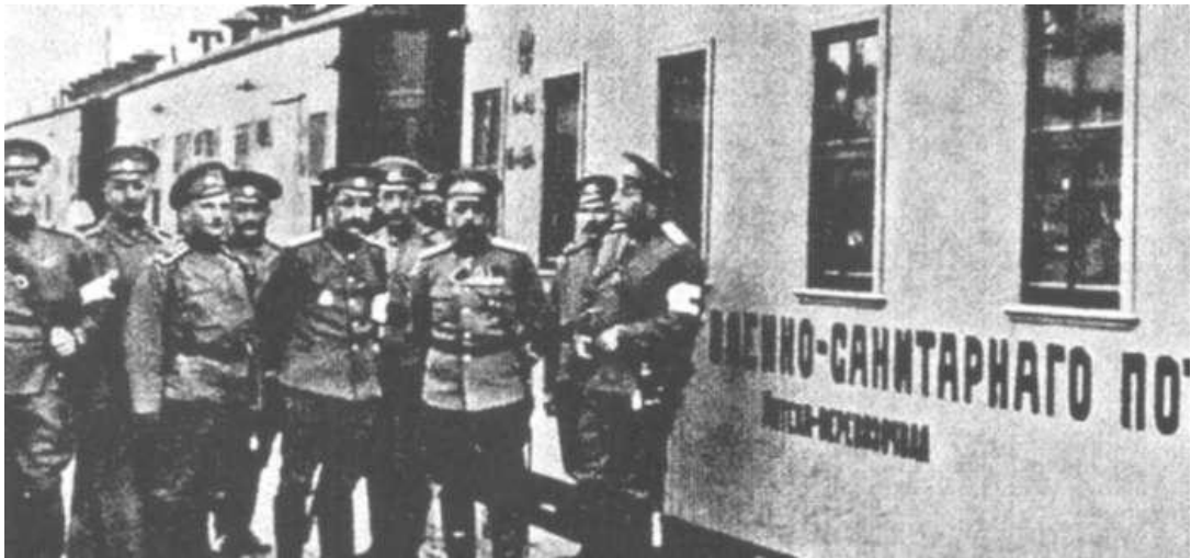
Ваенна-санітарны поезд у Баранавічах

У выніку 9-я армія Войрша ў складзе 7 нямецкіх і 2 аўстрыйскіх дывізіі займала фронт агульнай працягласцю 163 км. Умацаваная абарончая паласа гэтай арміі ў раёне Баранавічы – Цырын, дзе верагоднасць расійскага наступлення была найбольшай, уключала 3 лініі акупаў з інтэрвалам у 5 км. Акопы былі абсталяваны траверсамі, казыркамі, 613 пляцоўкамі для кулямэтаў, мелася болей за 400 гармат. Яшчэ 80 гармат з мэтай манеўравання і дастаўкі іх на самы патрэбны ўчастак фронту знаходзіліся напачатку на падводах у рэзерве.