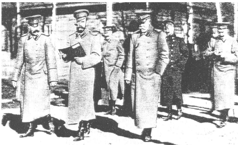
Мікалай II, генерал-ад'ютант Сухамлінаў, дварцовы камендант генерал Ваякоў, флігель-ад'ютанты Нарышкін, Саблін і хірург Фёдараў у Баранавічах.