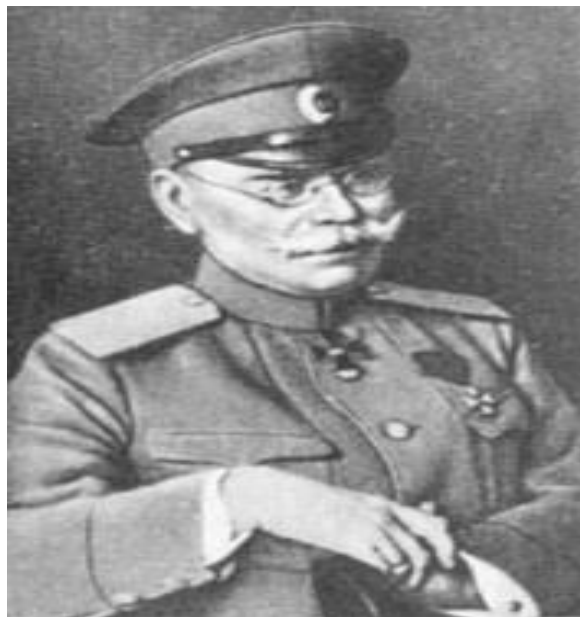
Генерал М.В. Аляксееў

У той жа час начальнікам штаба расійскага галоўнакамандавання М.В.Аляксеевым і галоўнакамандуючым Заходнім фронтам А.Е.Эвертам прымаліся ўсе неабходныя меры, якія на іх думку маглі паспрыяць дысцыпліне сярод салдат і абмежаваць доступ інфармацыі аб дэталях новага наступлення для праціўніка. Так падчас аперацыі выдаецца загад Эверта «Па барацьбе з п'янствам», дзе забараняецца ўсялякі продаж, набыццё і распіццё спіртных напіткаў [4]. А затым на падставе «Правіл аб мясцовасцях, аб'яўленых на ваенным становішчы» былі праведзены во-быскі сярод прыфрантавога насельніцтва, а таксама арганізаваны прагляд пісьмаў, запісаў салдат і г.д. [5].