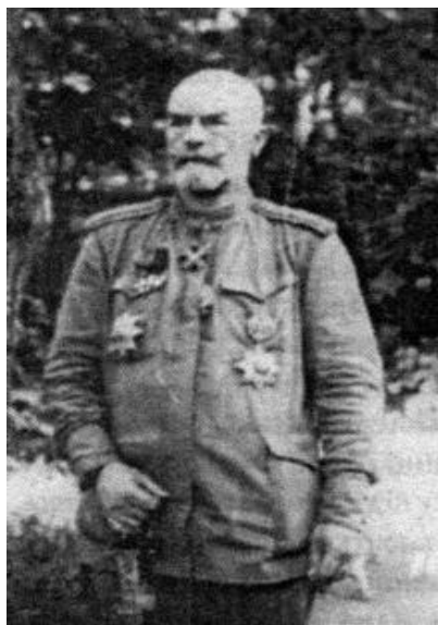
Генерал А.Ф. Рагоза

Такім чынам, канчатковай мэтай аперацыі быў адначасовы прарыв і ў раёне Ковеля, і ў раёне Баранавічаў. Сапраўды, у выпадку ўзяцця Баранавічаў і Ковеля прарыв расійскіх армій быў забяспечаны, так як войскі аўстрыйцаў і немцаў былі б раз'яднаны. У выніку адбыўся б стратэгічны разрыв, які ахапіў бы абодва флангі. А гэта значыць, што ўсё набытае аўстра-германскімі войскамі ў 1915 годзе пры прарыве ў раёне Горліца-Тарноў страчвалася б, што вяло да стратэгічнага паражэння ўсяго усходняга фронту.