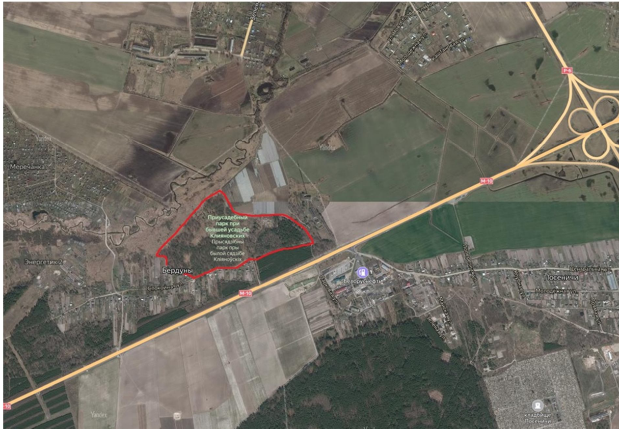
Рисуюк 1. – Границы исследуемой территории