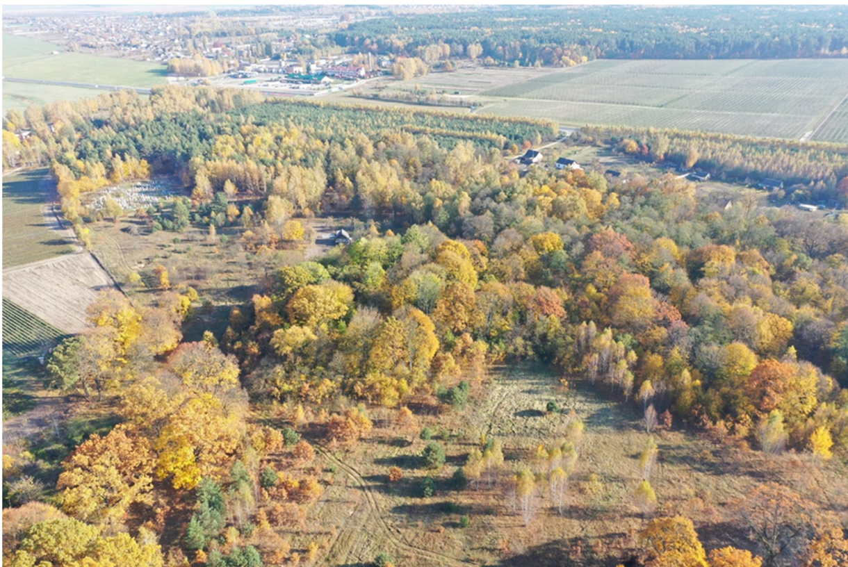
Рисуюк 2. – Вид сверху на территорию парка