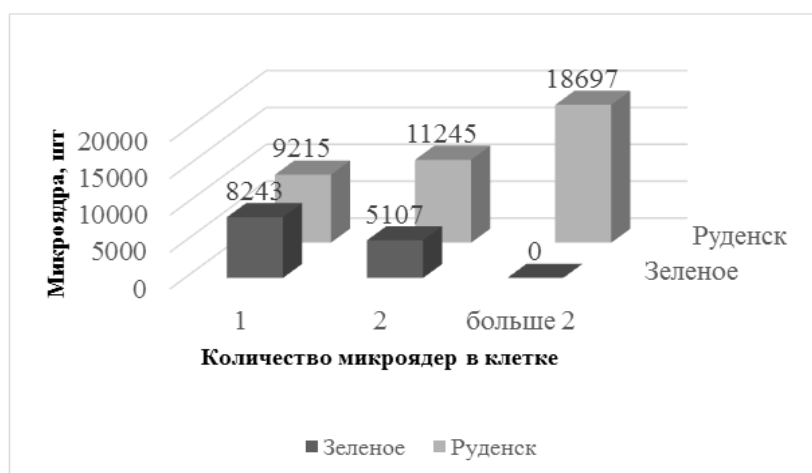
Рисунок 3. – Распределение количества микроядер в клетке в группах сравнения

На рисунке 3 мы наблюдаем увеличение эритроцитов более чем с двумя микроядрами (от 3 до 7 МЯ) в основной группе (г. Руденск), в то время как в контрольной группе (АБС «Зеленое») преобладают клетки с 1 МЯ, иногда с двумя МЯ.