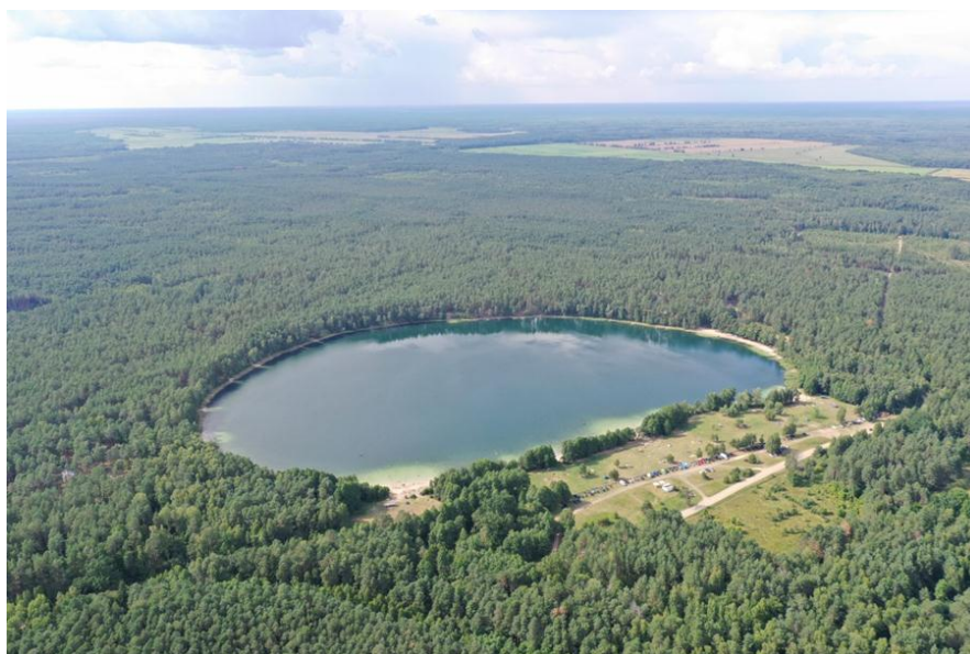
Рисунок 1. – Акватория о. Белое (съемка с высоты 100 м, квадрокоптер DJI Mavic 2 Pro)

Берега озера имеют высоту до двух метров и в основном песчаные, покрыты травянистой и древесно-кустарниковой растительностью.