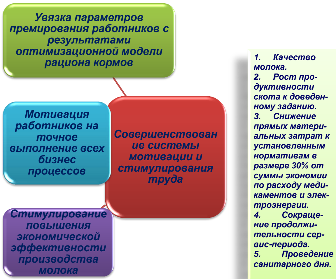
Рисунок 5. – Логическая схема системы мотивации и стимулирования труда работников молочного скотоводства

Задание по удою молока доводится ежемесячно исходя из утвержденного годового задания по организации, молочно-товарной ферме.