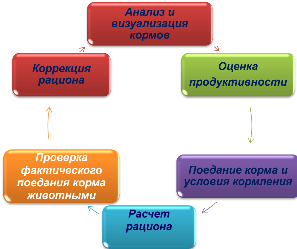
Рисунок 2 – Алгоритм оптимизации рационов кормления животных

Уникальность составления рациона реализуется системным подходом в установлении состояния функций продуктивности организма и обеспечении их питательными веществами, включающим современную оценку кормов по чистой энергии лактации (ЧЭЛ), кишечно-усваиваемому протеину (кСП), структурным и неструктурным угле-