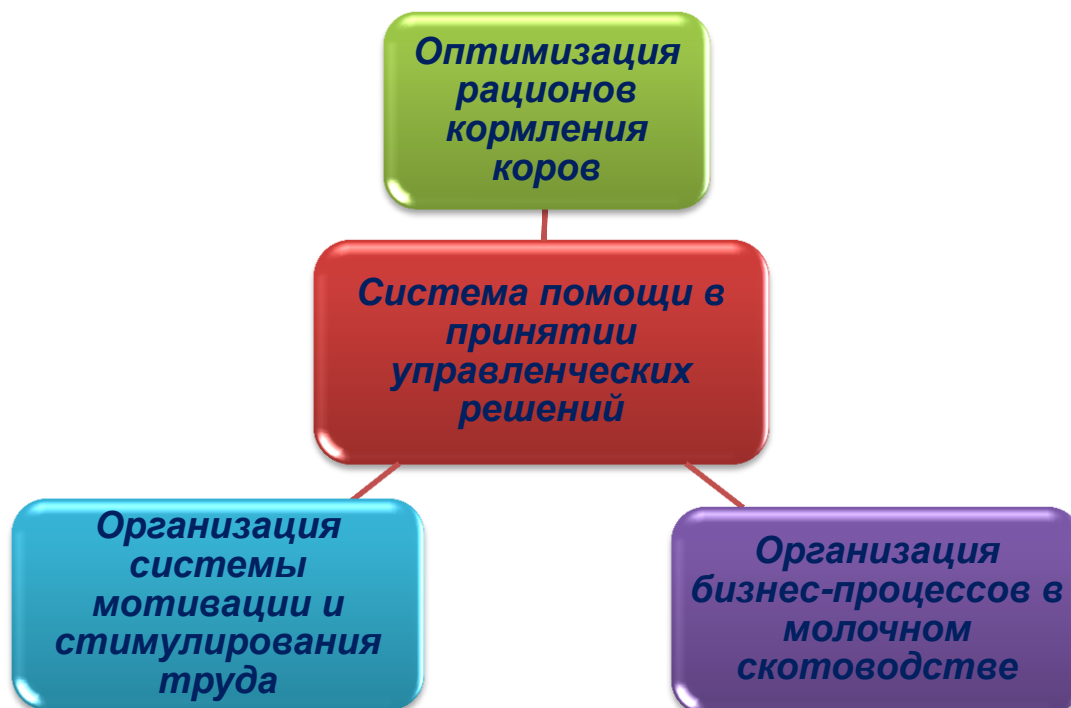
Рисунок 1 – Логическая структура системы помощи в принятии управленческих решений в молочном скотоводстве, разработанная в Полесском государственном университете