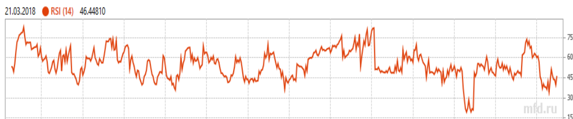
Рисунок 4 – Показатель RSI для компании «Мвидео»