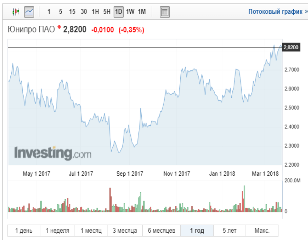
Рисунок 7 – Цена акции компании Юнипро