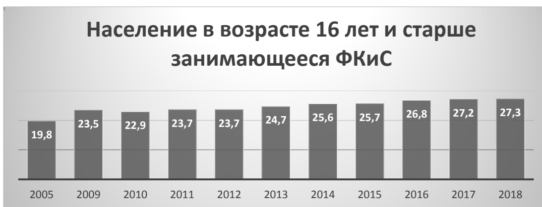
Рисунок 3 – Процент занимающихся ФКиС в Республике Беларусь от 16 лет и старше

Как видно из приведенных результатов опроса гомельчан, основной причиной, препятствующей регулярным занятиям ФКиС, является недостаток свободного времени (более 65% опрошенных) и недостаток требуемых денежных средств (более 16% опрошенных). На наш взгляд, такая ситуация говорит о том, что большинство тех, кто не занимается регулярными физическими упражнениями, все-таки не считают эти занятия настолько важными и необходимыми для их здоровья, чтобы найти в своем жизненном расписании время и денежные средства. Кроме того, невысокий средний уровень доходов населения по отношению к среднеевропейскому вынуждает многих горожан искать себе дополнительную подработку, увеличивая тем самым продолжительность дневного труда, а иногда отказывая себе даже в полноценных выходных днях, которые можно было использовать для активного отдыха и восстановления.