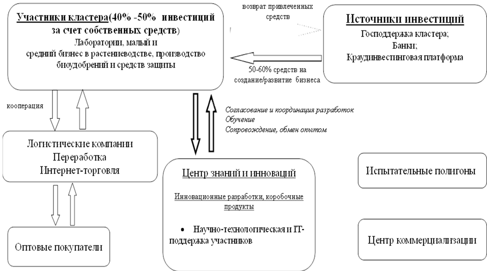
Рисунок 3. – Схема взаимодействия между участниками ИПК «Полесье», профиль «Растениеводство»

Примечание – Источник: составлено авторами