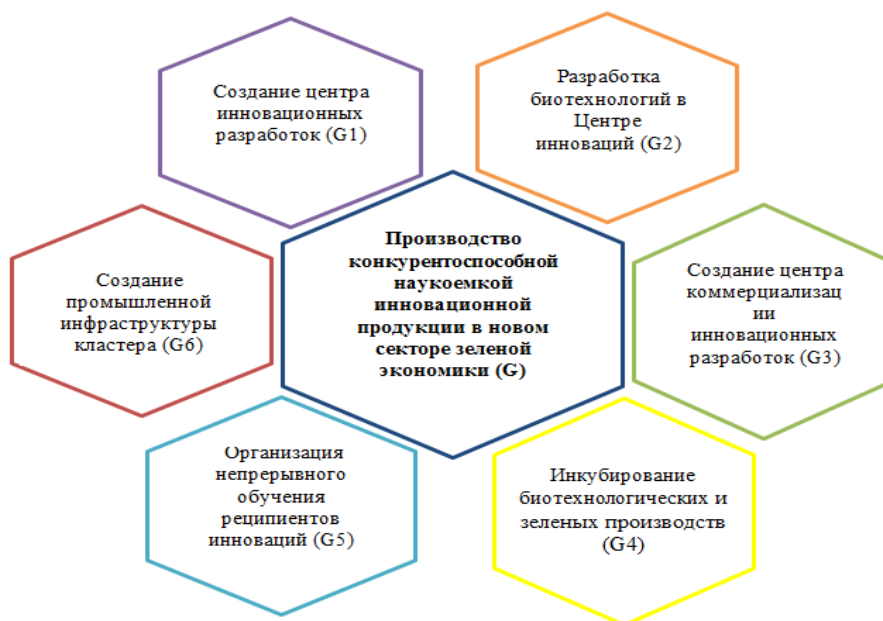
Рисунок 2. – Локальные цели первого уровня в кластере нового типа

Для промышленных кластеров характерны кооперационные формы взаимодействия участников: проведение совместных обучающих, рекламно-маркетинговых мероприятий, кооперационные поставки, которые сами по себе не могут создать платформу для развития инновационной деятельности.