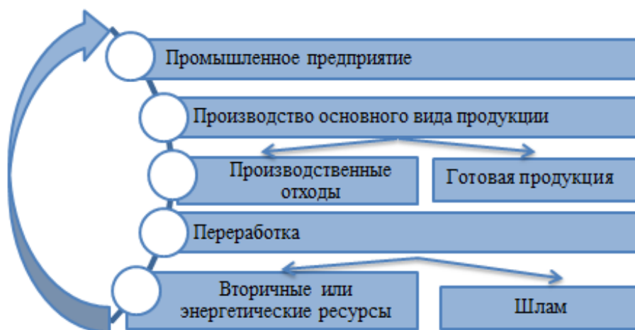
Рисунок 2. – Вариант структурной модели производства с замкнутым циклом ресурсооборота

Общие цели развития ЭП в соответствии с принципами целевого подхода необходимо структурировать, создавая многоуровневую систему локальных целей, в которой кластерный уровень является ключевой составляющей. Кластеры могут стать площадкой генерации новых идей и практической апробации решений по ЭП.