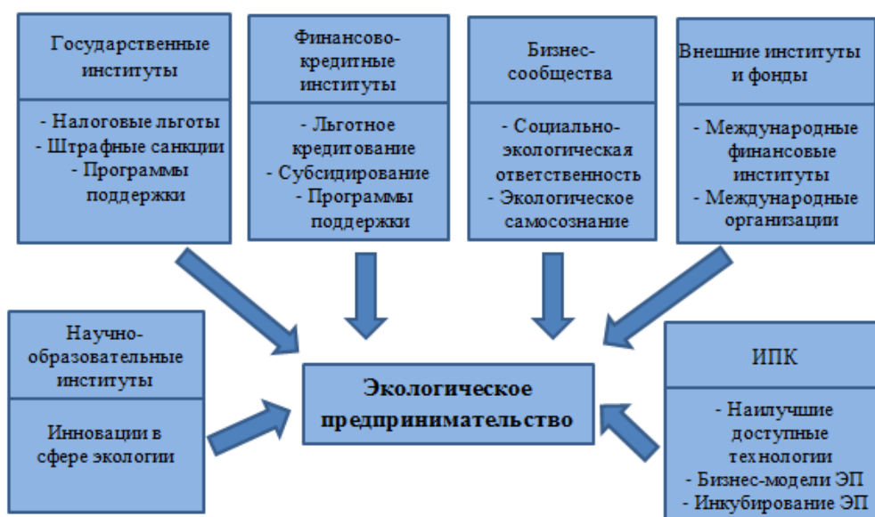
Рисунок 3. – Составляющие среды экологического предпринимательства

Обобщая, выделим составляющие институциональной среды, способствующие развитию ЭП: государственные институты и формируемая ими нормативно-правовая база; финансово-кредитные организации и механизмы финансирования и кредитования ЭП; бизнес-сообщества; внешние институты и фонды с экологическими инициативами (грантами, программами и т.д.); научные и образовательные учреждения, генерирующие инновационные решения; инновационно-промышленные кластеры (рис. 3).