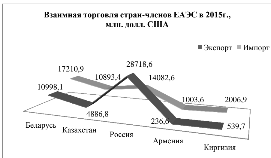
Рисунок 1 – Взаимная торговля стран-членов ЕАЭС в 2015 г., млн. долл. США Примечание – Разработка авторов на основе [8].