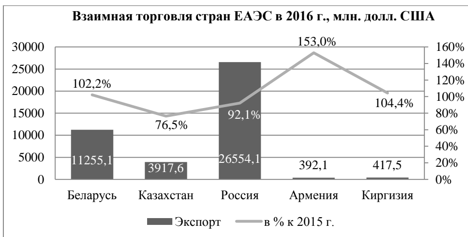
Рисунок 3 – Взаимная торговля стран ЕАЭС в 2016 г., млн. долл. США Примечание – Разработка авторов на основе [8].