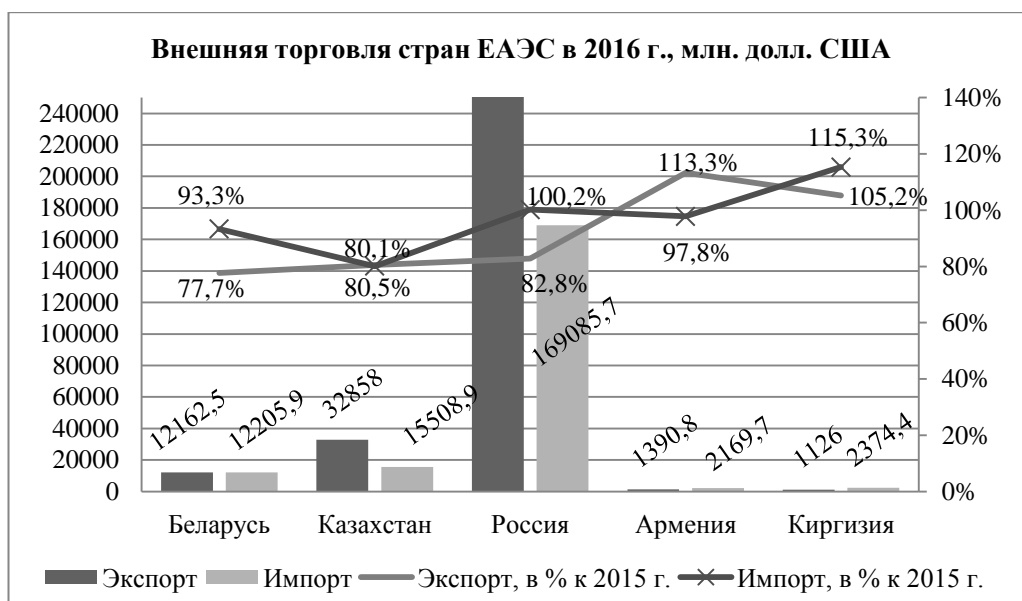
Рисунок 4 – Внешняя торговля стран ЕАЭС в 2016 г., млн. долл. США

Примечание – Разработка авторов на основе [8].