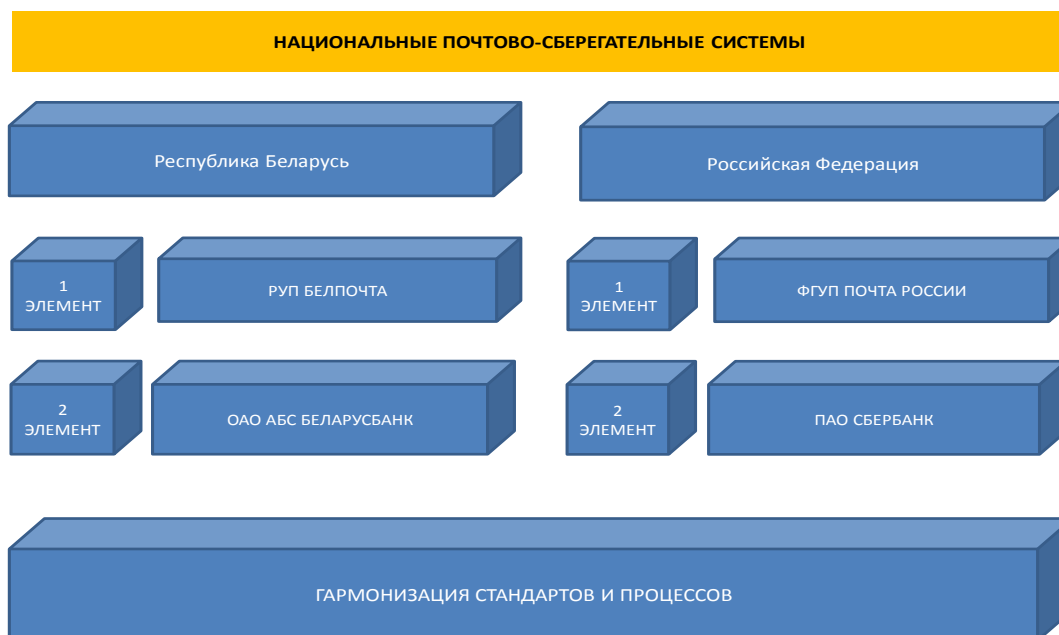
Схема 1 – Национальные почтово–сберегательные системы (ПСС)

Следует отметить, что создание национальных почтово–сберегательных систем вполне вписывается в статьи 30 и 31 Договора о Союзном государстве, гласящие, что в пределах Союзного государства функционируют объединенные энергетическая, транспортная системы, взаимоувязанные системы связи и телекоммуникаций, в также в Союзном государстве действует унифицированное трудовое законодательство, законодательство в области социальной защиты населения, пенсионного обеспечения. Симультанное создание почтово–сберегательных систем и их синергетические усилия стали бы их органическим дополнением в рамках упомянутых статей.