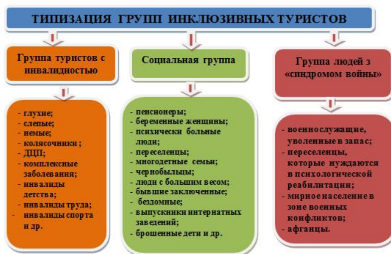
Рисунок 2. – Схема типизации групп инклюзивных туристов в Украине

Выделим следующие факторы, которые ограничивают или влияют на возможность организации инклюзивного туризма в Украине [10, с. 85-95]: