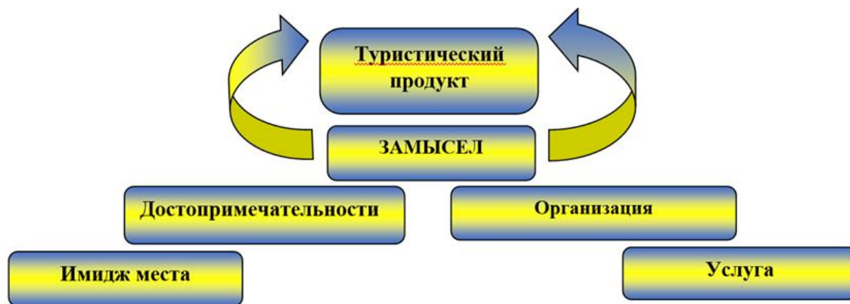
Рисунок 1. – Составляющие туристического продукта

По состоянию на конец 2019 года в Украинский национальный перечень внесены 14 элементов нематериального культурного наследия (таблица 1).