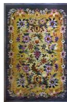
Рисунок 2. – Работы мастеров вышивки и ковроткачества: а – Ю. Тушко, б – А. Бабенко