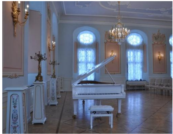
Рис. 4. Театральный зал