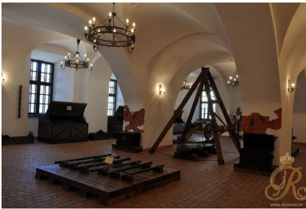
Рис. 5. Арсенал