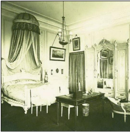
Рис. 9. Спальня