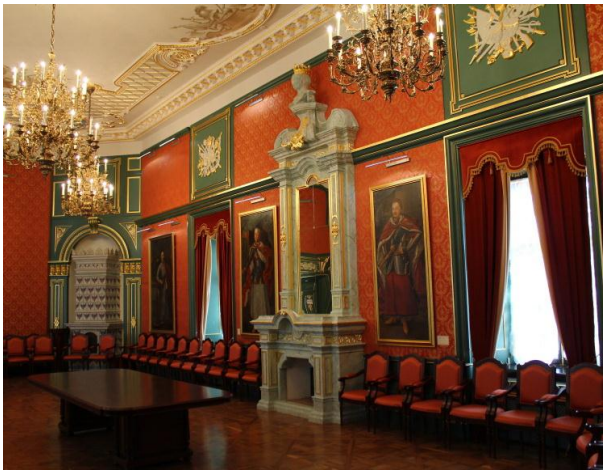
Рис. 3. Гетманский зал