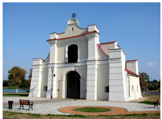
Рис. 14. Слуцкая брама