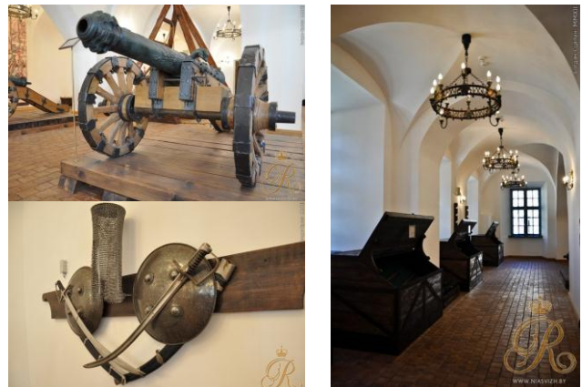
Рис. 6. Арсенал