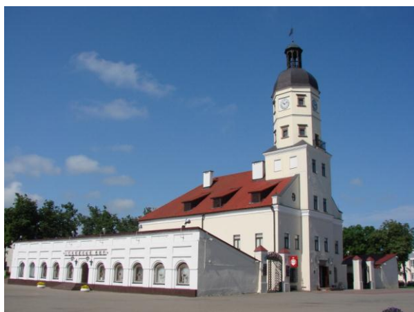
Рис. 13. Ратуша, торговые ряды