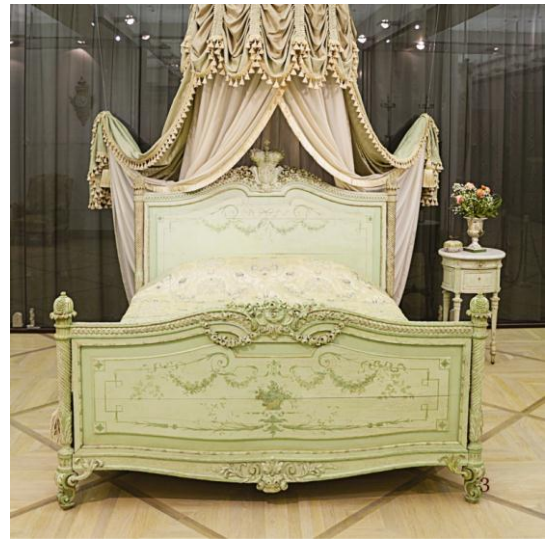
Рис. 10. Спальня