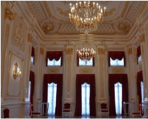
Рис. 1. Золотой зал