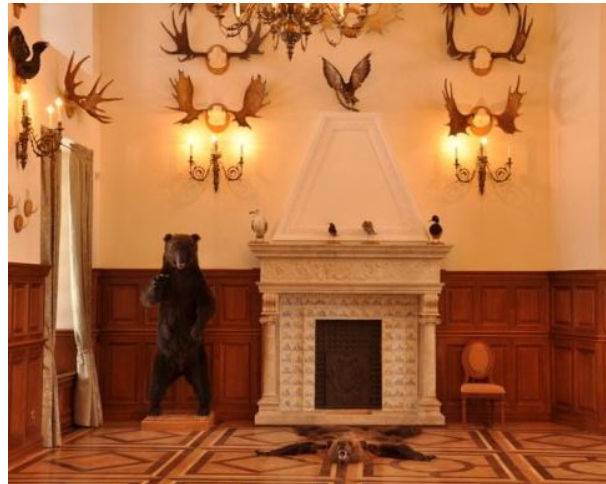
Рис. 2. Охотничий зал