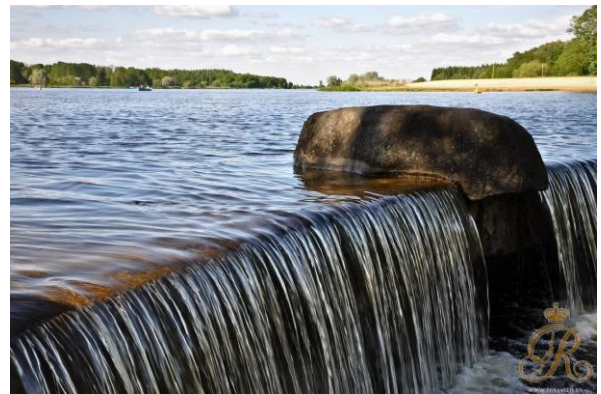
Рис. 12. Парки