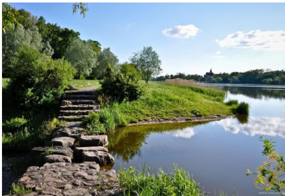
Рис. 11. Парки