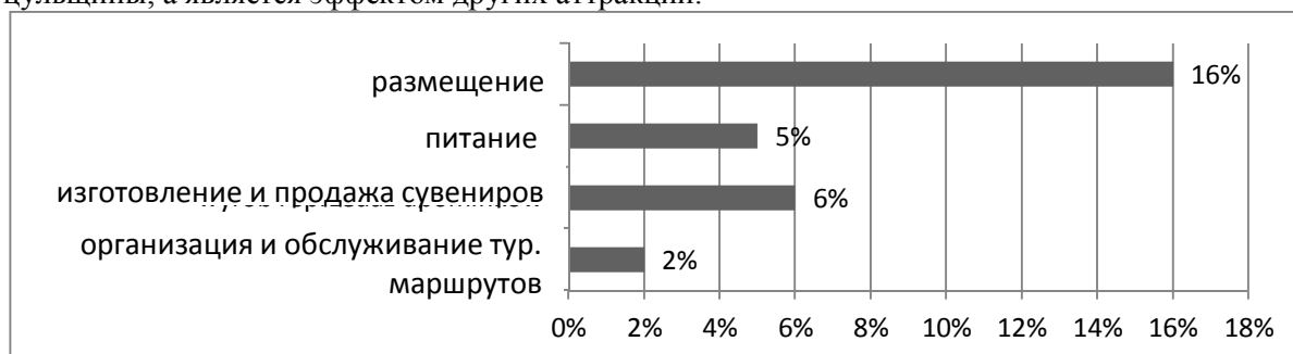
Рисунок 2 – Структура туристских услуг, предоставляемых на Гуцульщине [5].

Туризм, с одной стороны, приводит к активизации регионов, предоставляя материальную выгоду местному населению, а с другой стороны – негативно влияет на качество их жизни. Чрезмерное увлечение туристской индустрией провоцирует зависимость от нее местной экономики и при уменьшении туристского движения может привести к негативным последствиям. Уже сейчас на Гуцульщине наблюдается постепенный отказ от характерного для данного региона ведения хозяйства в пользу предоставления туристских услуг. Для значительной части жителей Гуцульщины туризм стал главным источником доходов (рис. 2). Как показывают результаты анкетирования, каждый четвертый респондент региона связан с туристской деятельностью. При этом значительная часть туристского предложения в регионе не связана с культурным наследием Гуцульщины, а является эффектом других аттракций.