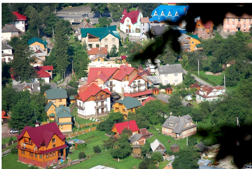
Рисунок 5 – Изменение традиционного гуцульского ландшафта г. Яремче вследствие развития туристской инфраструктуры

По мере роста туристической атрактивности Карпатского региона и вместе с этим туристского движения возникает такое негативное явление, как коммерциализация местной культуры. В свою очередь она приводит к упрощению культуры и возникновению псевдокультурных явлений. Так,