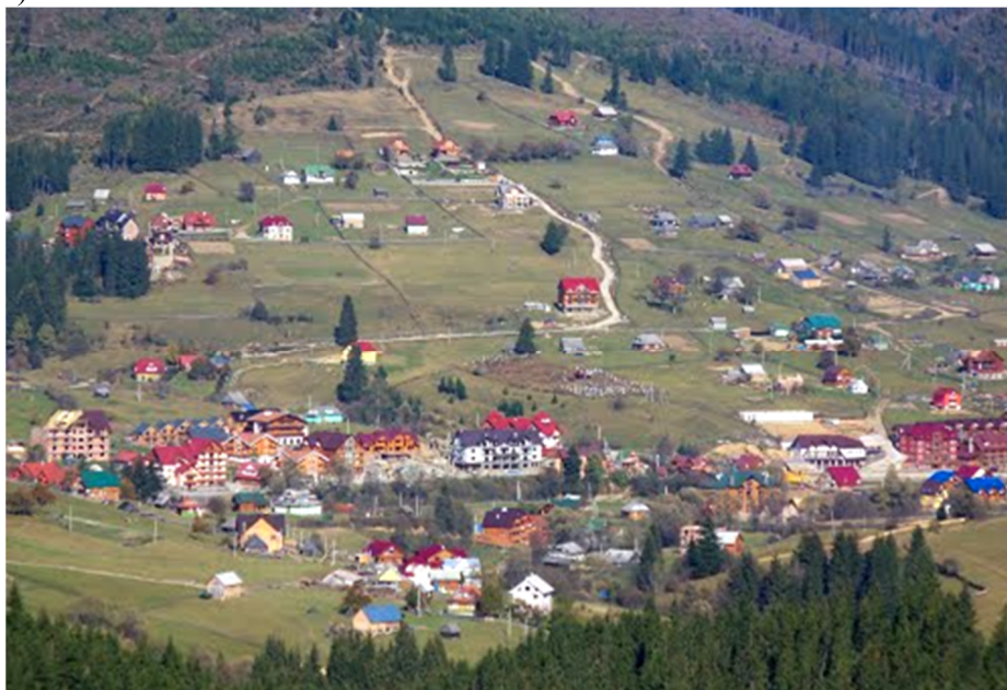
Рисунок 3 – Село Поляница с доминированием туристской инфраструктуры в традиционном гуцульском ландшафте.

Особенно следует выделить село Поляница, которое после открытия популярного туристического комплекса Буковель в 2000 году бесповоротно поддается аккультурации. В течение одного сезона Буковель посещает до 1,5 миллиона туристов. Поэтому Поляницу можно считать первым селом Гуцульщины, которое подверглось аккультурации вследствие развития туризма (рис. 3).