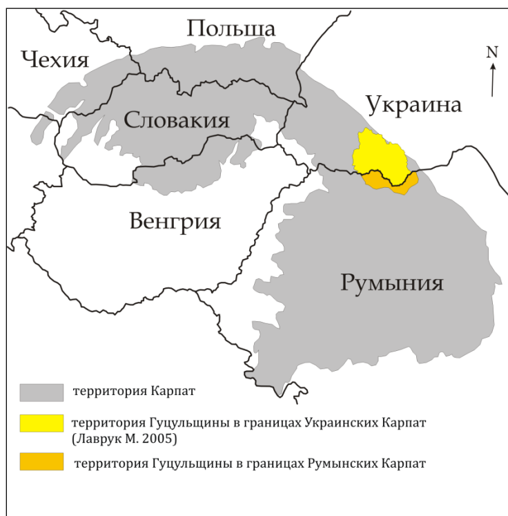
Рисунок 1 – Территория Гуцульщины в границах Карпат

Гуцульщина – интересная в ландшафтном, биогеографическом и этнографическом отношении территория Украинских Карпат, обладающая первозданной природой и заселенная самобытным народом, который сохранил свою этническую автохтонность. В геокультурном пространстве Украины и Карпат Гуцульщина выделяется, прежде всего, оригинальным культурным ландшафтом – сочетанием природных и созданных человеком особенностей геопространства. К сожалению, культурное разнообразие в современном мире находится под угрозой. Этот риск обусловлен наблюдаемыми процессами аккультурации, которые на Гуцульщине представляют собой сложный процесс диффузии [7]. В случае Гуцульщины аккультурация находится на раннем этапе. Можно утверждать, что процесс этот протекает вследствие длительного контакта гуцульской культуры с другими карпатскими культурами (лемками, бойками, покутянами), а также с другими культурами государств, к которым принадлежала и принадлежит Гуцульщина (Польша, Румыния, Советский Союз, Украина). Как негативное явление следует отметить тот факт, что культура, традиции, обычаи, народная одежда, гуцульская музыка начинает, по крайней мере, внешне, уподобляться культуре остальной части Украины. С другой стороны, Украина в поисках культурных корней, часто выделяет Гуцульщину (наряду с культурой казачества) в качестве одного из источников национальной идентичности.