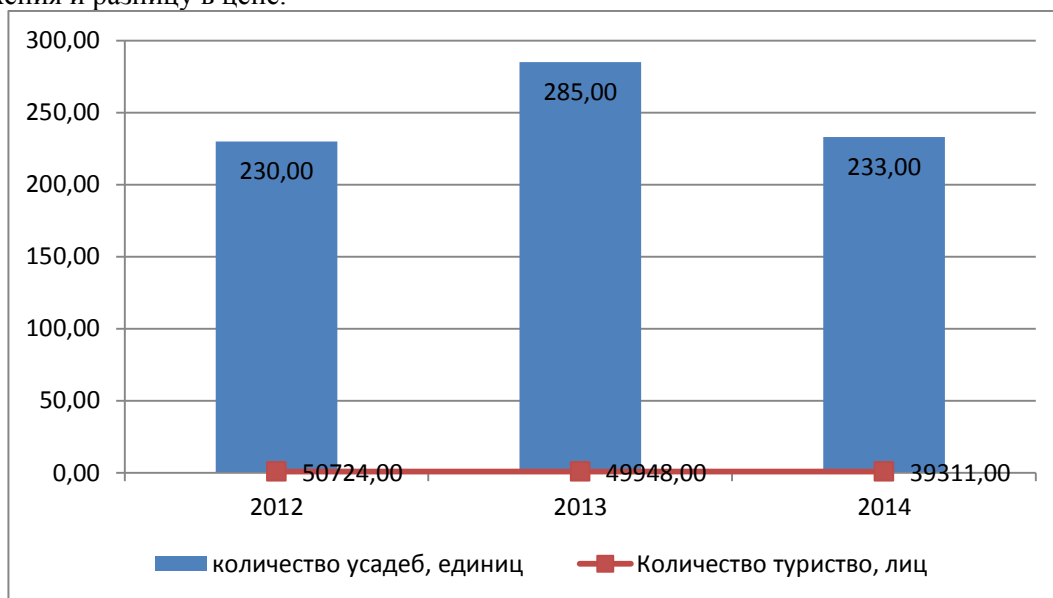
Рисунок 2 – Динамика количества усадеб в Украине и количестве туристов, которые их посетили в период 2012–2014 гг. [2–4]

По нашему мнению, такая ситуация временная, и для того чтобы сельский зеленый туризм развивался в будущем, нужно поддерживать определенные качества услуг и формировать их позитивный имидж на рынке предложений, то есть, прежде всего, необходимо создать благоприятные условия для получения сертификата категории «Украинская гостеприимная усадьба» и экологического сертификата «Зеленая усадьба», что, в свою очередь, предоставит возможность оказания качественных услуг отечественным и иностранным туристам. Принимая во внимание все вышесказанное, актуальным является более глубокое изучение вопроса категоризации агроусадьб, которое обеспечит прозрачность предложения для клиента, контроль качества продукта, разнообразие предложения и разницу в цене.