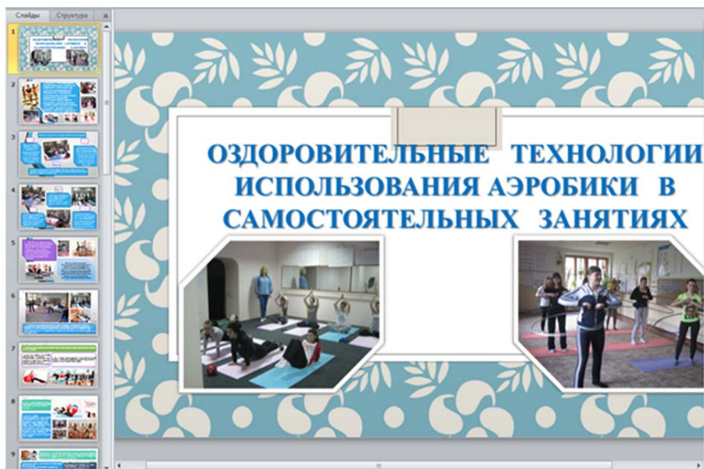
Рисунок 3. – Учебные мультимедийные пособия для самостоятельной подготовки к физкультурно-оздоровительным занятиям

Выводы. В новых современных моделях найдены возможности целесообразного и системного согласования определенных компонентов образовательной деятельности и факторов обеспечения индивидуализации целей, содержания, форм, средств и способов организации образовательного процесса по физической культуре, создание соответствующей здоровьесохраняющей образовательной среды, организационного сопровождения учебного процесса, направленного на удовлетворение образовательных потребностей каждого.